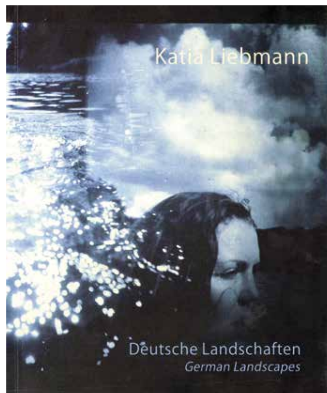
Abb. 11 Katalog Deutsche Landschaften, Berlin 2009