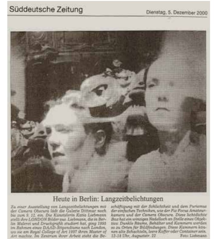
Abb. 10 Ausstellung London Ornaments, Galerie Dittmar, Süddeutsche Zeitung, 5. Dezember 2000

Seit diesem Jahr Dozentin für künstlerische Druckgrafik und frühe fotografische Verfahren an der Carl von Ossietzky Universität in Oldenburg.