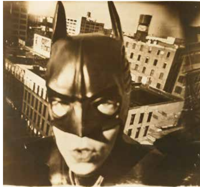
Abb. 8 Gotham City, 1997, 60 x 70 cm, Abb.in: Dick Price, The New Neurotic Realism, 1998, Saatchi Gallery, London