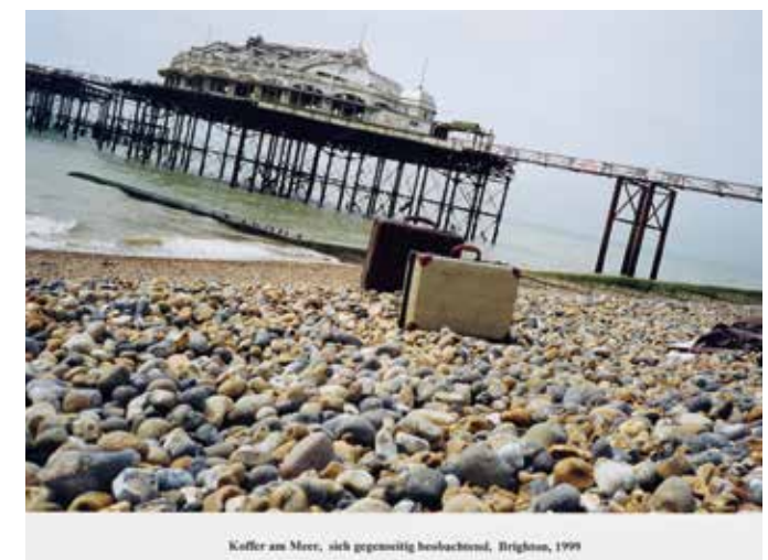
Abb. 9 „The Brighton Walk“, Zwei Camera Obscura-Koffer beobachten und belichten einander. Brighton, 1999 (Projekt Hasselblad Foundation, Göteborg)