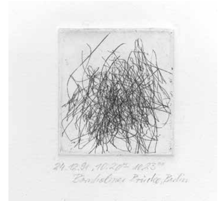
Abb. 2 Seismografische Aufzeichnung, 1991, Radierung, 28 x 28 cm. Bezeichnet: 24.12.91, 10.20-10.23 Uhr, Bornholmer Brücke, Berlin.

Gründung der Werkstatt für Handsatz und Typografie „Unikat Rothspalk“ in Rothspalk, Mecklenburg. Typografie, Handsatz und Druck eigener Unikatbücher, sowie