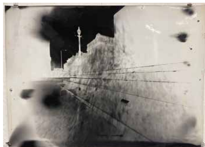
Abb. 4 Picadilly Circus, Rushhour, London 1997, Papiernegativ, 57 x 75 cm (siehe Bildteil, Abb. 18)

Während der Zeit am Royal College of Art ergibt sich ein mehrmonatiger Studien- und Lehraufenthalt an der State University New York. Es entsteht die Werkgruppe