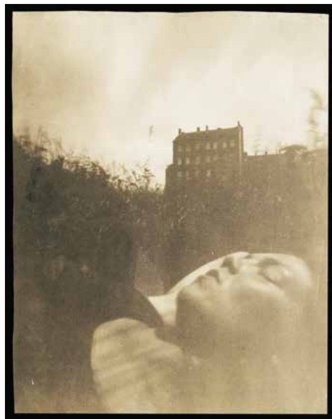
Abb. 3 Grenzstreifen 2, Berlin, 1994, Camera Obscura, Salzdruck getont, 58 x 45 cm

Der vollständige Titel lautet: „Berlin – Erschütterungen einer Stadt. Seismografische und Fotografische Aufzeichnungen in öffentlichen Verkehrsmitteln“ (Bildteil S. 19-21).