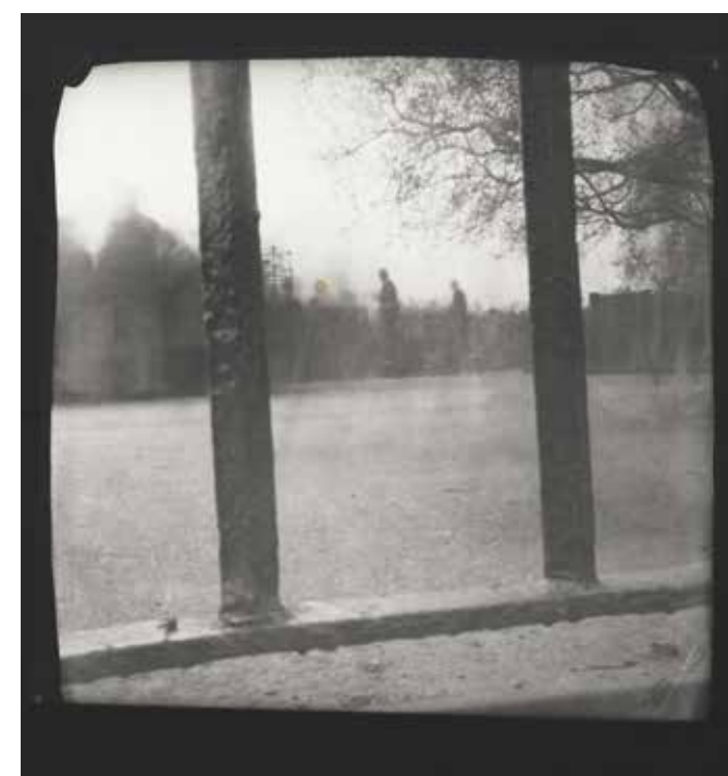
Abb. 5 Beweise, Hyde Park, London 1997, 11 min Lichteinfall, Camera Obscura, 28 x 28 cm