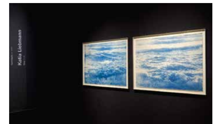
Abb. 13 Ausstellung Ein Gramm Licht, Museen der Stadt Nürnberg, 2014

Im gleichen Jahr Beginn der Werkgruppe „Langsamkeit“. Sie knüpft an die früheren Fahrtbilder an.