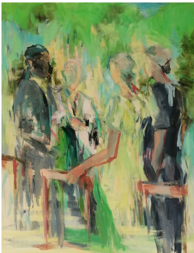
Sommerfest · 2026 · Öl auf Leinwand · 90 x 70 cm

Das Schwarz der Nacht ist physikalisch-poetisch gesehen die Summe aller Energien, malerisch gesprochen die Summe aller Farben. Das Licht des Tages spaltet diese Summe auf. Die Differenzen der unendlich fein unterscheidbaren Farbfrequenzen, der Farbnuancen, werden sichtbar, wenn das Licht auf Gegenstände fällt und die Vielfalt dessen ansehbar macht, was auf diesem Erdball lebt und gemacht worden ist.