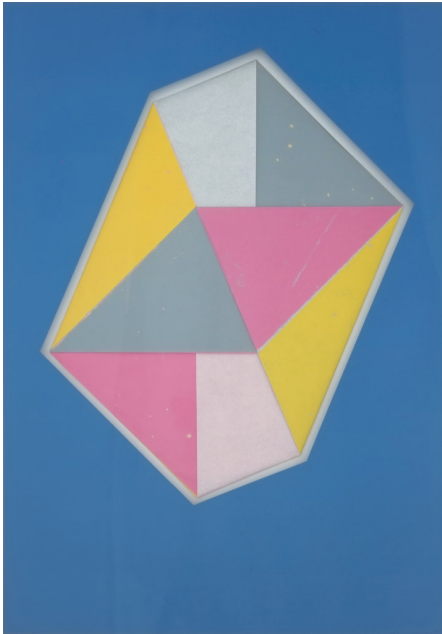
Benjamin Badock · Straight · 2016 · Hochdruck zweiseitig auf Seidenpapier (Gefaltet) Hinterglasmalerei · 85 x 64 cm